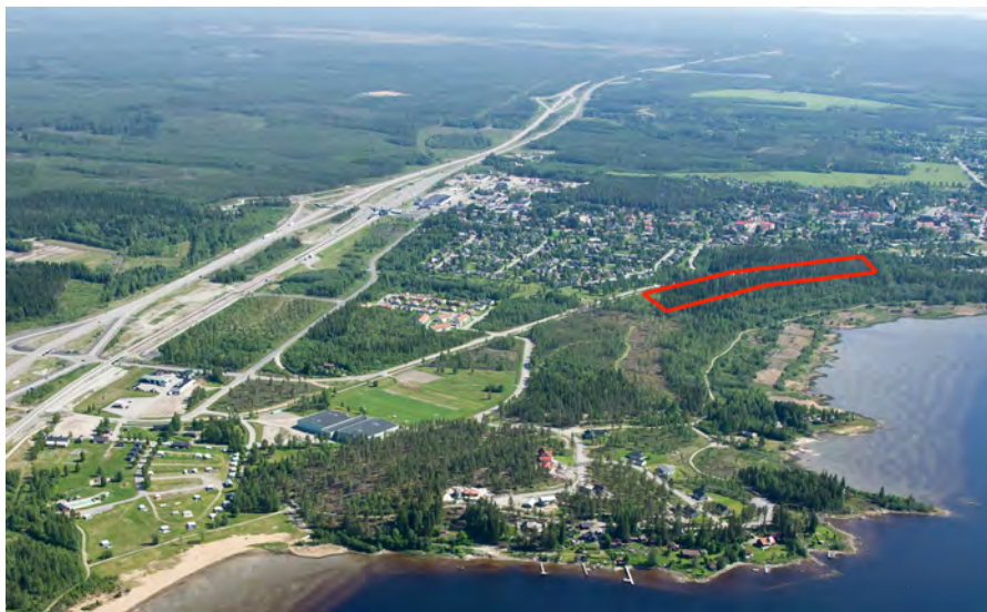
Ungefärlig utbredning av utvecklingsområdet vid Rödviksvägen som idag inte är bebyggt markerat med rött.

Översiktsplanen anger att livsvillkor för djur- och växter ska vara vägledande för framtida beslut om muddring och att hamnanläggningar bör anläggas gemensamt för att begränsa behov av muddring. Planen anger även att enskilda avlopp ska anläggas så att negativ påverkan på vattenförekomster kan undvikas. Planförslaget skiljer sig inte från nollalternativet i detta avseende.