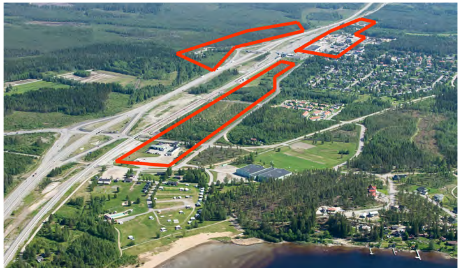
Ungefärlig utbredning av områden för verksamheter och industrier i nollalternativet markerat med rött. Område som idag inte är detaljplanerat syns längst till vänster.

Bebyggelseutveckling i orter med service stärker underlaget för service och kollektivtrafik. Befintlig infrastruktur kan nyttjas, människors vardagsliv förenklas och anspråk på obebyggd mark kan begränsas. Det innebär också att negativ påverkan på landskapsbilden kan begränsas.