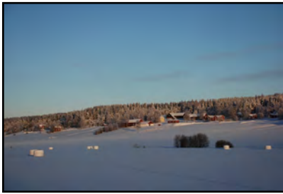
Vinterklätt odlingslandskap i Gräsmyr.