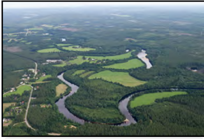
Lögde älv med karaktäristiskt meandrande lopp.