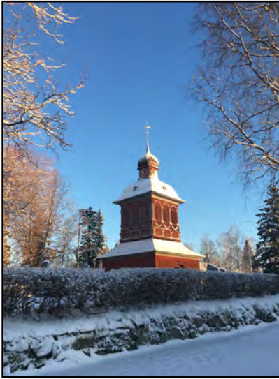
Klockstapel i Nordmaling.

I översiktsplanen finns övergripande riktlinjer som anger att exploatering inom eller i anslutning till områden av riksintresse för kulturmiljövården ska föregås av bedömning av påverkan på kulturmiljö och behov av anpassningsåtgärder.