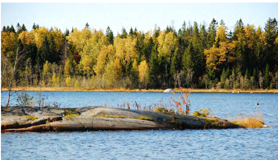
Kustlandskap i Kronören.