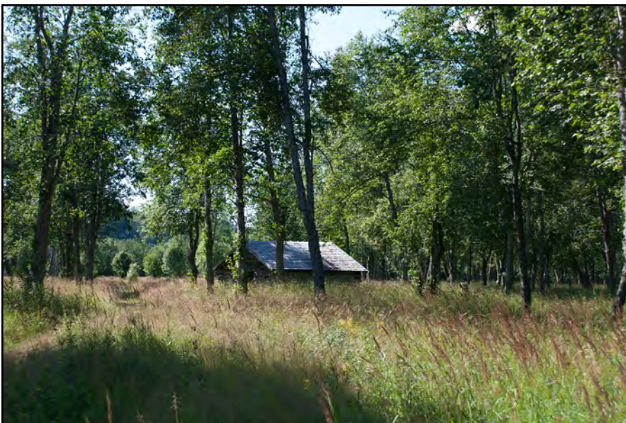
Slätteräng i Hummeholm.

En utveckling i enlighet med nollalternativet skulle innebära att det saknas riktlinjer och vägledning för utveckling av täktverksamheter som kan påverka landskapsbilden negativt. Enligt nollalternativet ska ny bostadsbebyggelse hänvisas till orter med service eller i anslutning till befintliga bostäder vilket begränsar påverkan på landskapsbilden. I centralorten pekas två obebbyggda områden ut för bostäder vilket kan innebära att landskapsbilden påverkas negativt. Bebyggelse kan också tillåtas i områden för landsbygdsutveckling i strandnära lägen vilket dock inte tillåts i sådan utsträckning eller omfattning att det bedöms orsaka betydande negativ påverkan på landskapsbilden. Jord- och skogsbrukets intressen ska särskilt beaktas. Stora opåverkade områden ska så långt som möjligt skyddas mot åtgärder som kan påverka deras karaktär vilket begränsar påverkan.