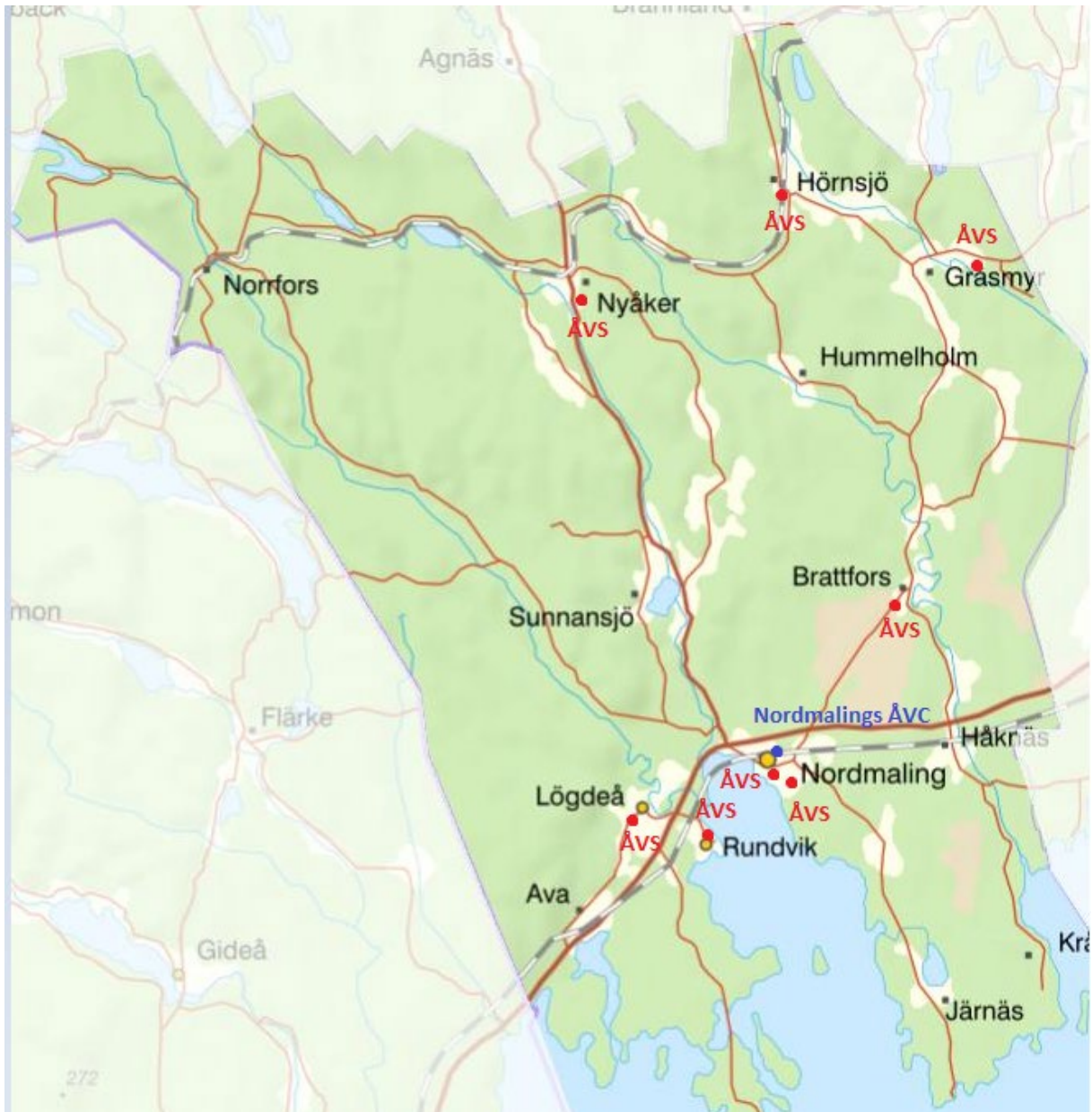
Karta över Nordmalings kommun. Röda prickar visar Nordmalings återvinningsstationer (ÅVS) och den blå prickken visar Nordmalings återvinningscentral (ÅVC)